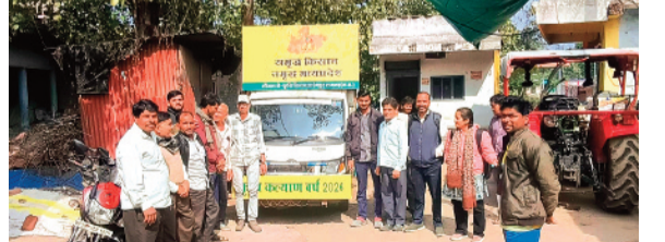
हरिभूमि न्यूज | सारंगपुर