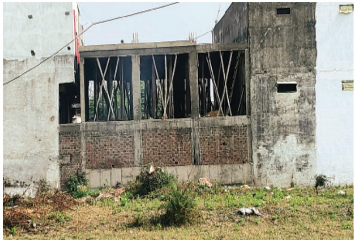
हरिभूमि न्यूज | ब्यावरा

पटवारी ने किसको लाभ देने के लिए रिपोर्ट में भूमि को विवादित होना छुपाया